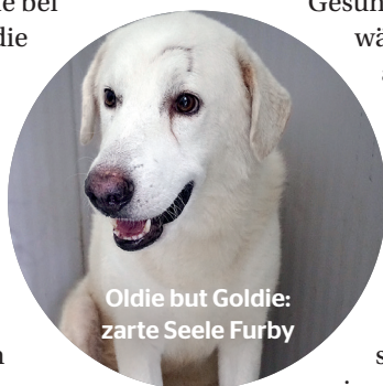
Oldie but Goldie: zarte Seele Furby

Schmitz. Der aufgeweckte Macchia wird sich schnell in eine Familie integrieren. Und Furby hätte doppelte Geborgenheit – durch Macchia und gute Menschen – mehr als verdient. So sucht das Notfell-Pärchen auf diesem Weg sein Glück zu zweit bei liebevollen Hundeverstehern, die wahre Freundschaft zu schätzen wissen. ULRIKE HAVERKAMP