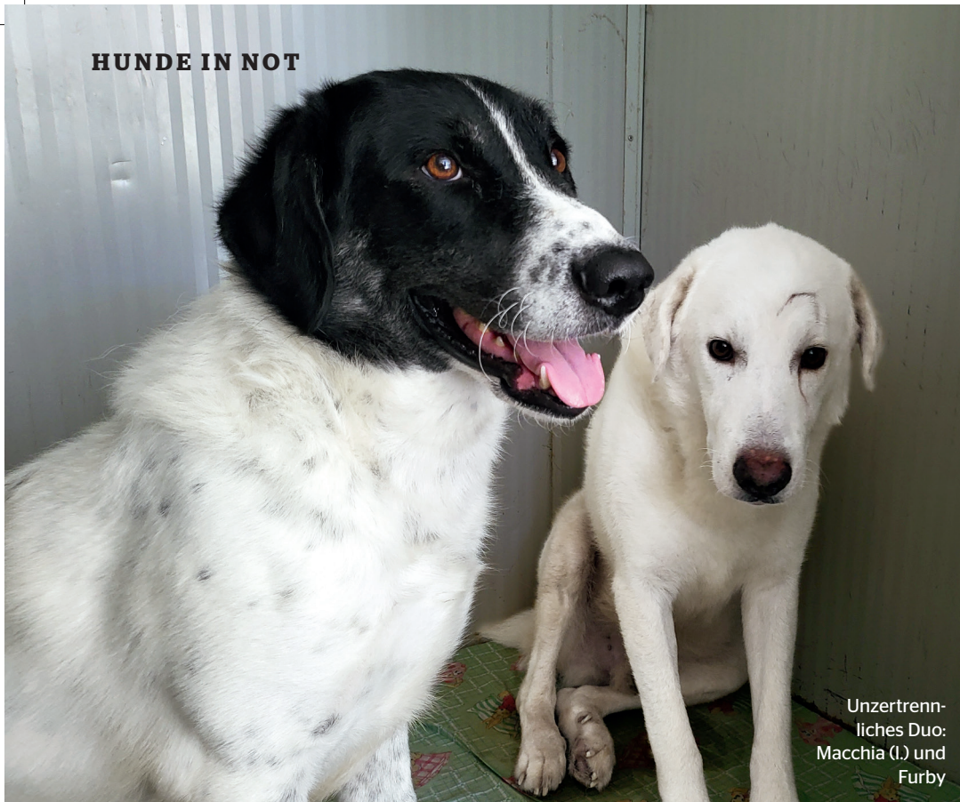
Unzertrennliches Duo: Macchia (l.) und Furby